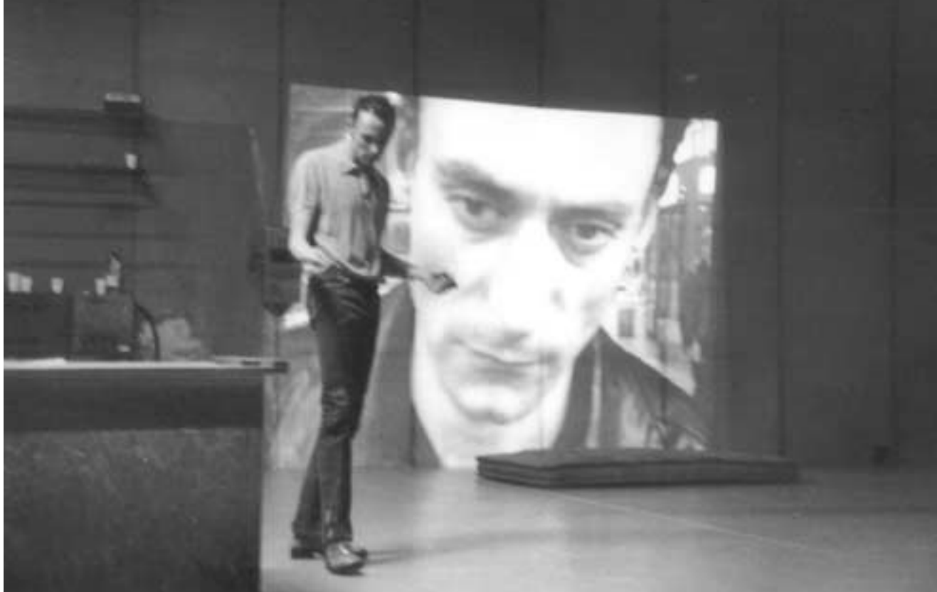
Festival La Bâtie Alibi Chor. Meg Stuart