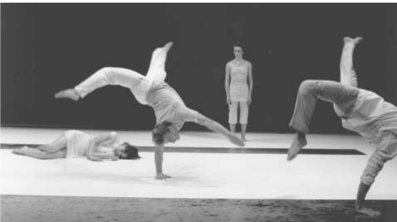
Utopie Chor. Michèle Anne De Mey