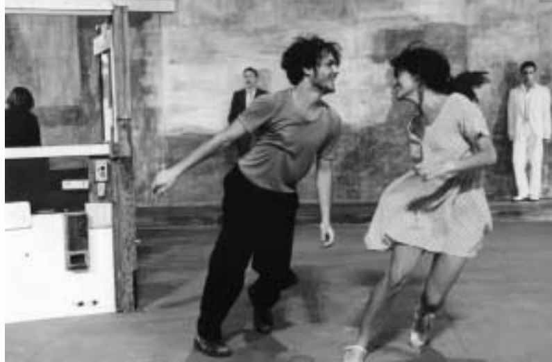
Festival de Marseille Zweiland Chor. Sasha Waltz & guets

Manifestation avignonnaise dans le off du festival, L'Été des hivernales est toute entière consacrée à la danse avec l'invitation de quatre compagnies, un stand d'information sur toutes les compagnies présentes au festival, ouvert au public et aux professionnels, et un ciné-danse. Le duo que Valérie Rivière propose sur le thème de la clandestinité, de l'anonymat et de l'errance est inspiré par la musique de Manu Chao, Clandestino . Enchantements et désenchantements d'un voyage au no man's land. Opiyo Okach, Kenyan d'origine, appartient à la nouvelle génération de chorégraphes africains qui travaillent autour du théâtre corporel et des rituels. Son solo, Dilo , inspiré par un rocher légendaire qui tient à la fois du dieu, du sorcier, du guérisseur, du devin et de l'esprit, est réinventé selon le moment, le lieu et le public et inspire une danse dépouillée et minimaliste, lente et sculpturale. Recomposées dans l'instant selon des règles de jeu préétablies et perturbées live par les interventions d'un