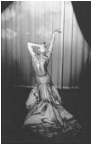
Festival Bellone/Brigittines Pin Up Chor. Thierry Smits

31/8 Wim Vandekeybus Bericht aan de bevolking/ Avis à la population Entrepôt, dans le cadre de Bruges 2002 (070/22 33 02)