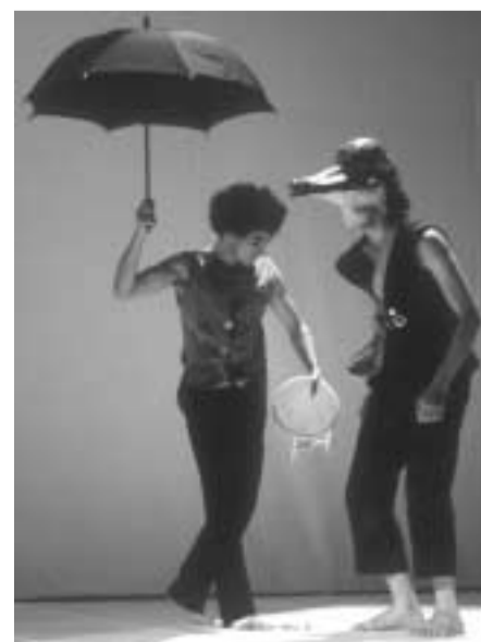
Biennale de la Danse Nestorov.eps Cia Paula Nestorov