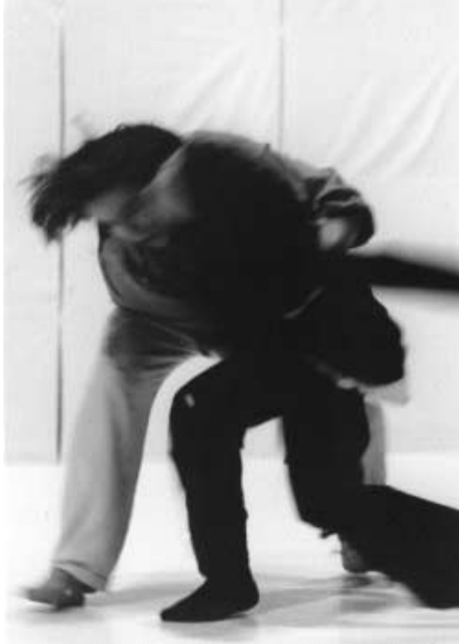
In Vivo Cie Jean Gaudin