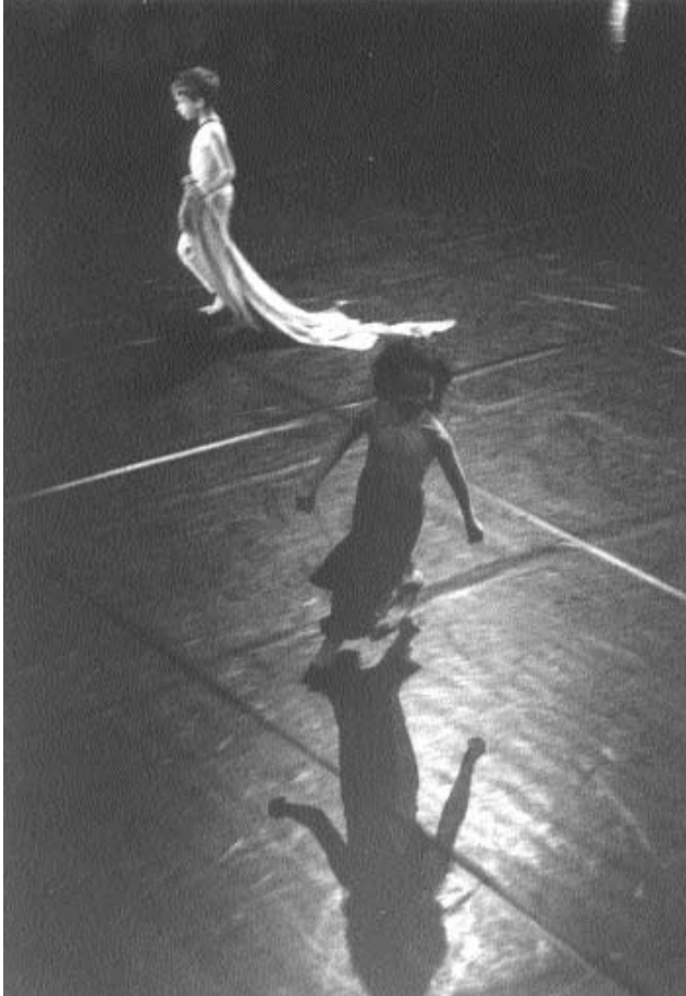
Danse au Cœur

Depuis plusieurs années, l'Esplanade Saint-Etienne Jeunes Publics programme et coproduit des œuvres chorégraphiques en direction des jeunes. Ainsi, les rencontres Enfance Danse qui, depuis sept ans, sensibilisent à l'art chorégraphique le public d'aujourd'hui et de demain, via des spectacles, des rencontres et des cours.