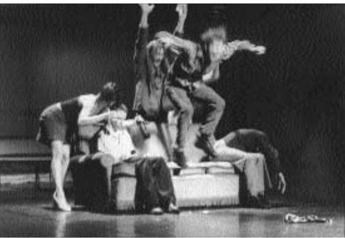
La Sortie Les Ballets C. de la B. Hans van den Broeck