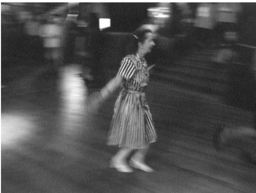
Bal Moderne/Bruxelles 2000 Salle de la Madeleine

Frédéric Flamand travaille actuellement avec l'architecte Jean Nouvel à l'élaboration d'un spectacle pour le parc thématique de l'Exposition universelle de Hanovre 2000. Il y présentera une fresque multimédia "provocante" et "contradictoire" sur le thème de l'Expo: le futur du travail. Trente danseurs seront démultipliés virtuellement live dans une série d'environnements tandis que le spectacle se déroulera dans une arène en forme d'ellipse de 60 sur 25 mètres conçue par l'architecte et empruntée par les visiteurs de l'Expo. Sa durée: dix heures par jour pendant toute l'exposition. Par ailleurs, EJM2 que Frédéric Flamand avait créé en 1998 pour le Ballet de l'Opéra national de Lyon sera l'invité du Théâtre du Châtelet à Paris les 28 et 29 mai.