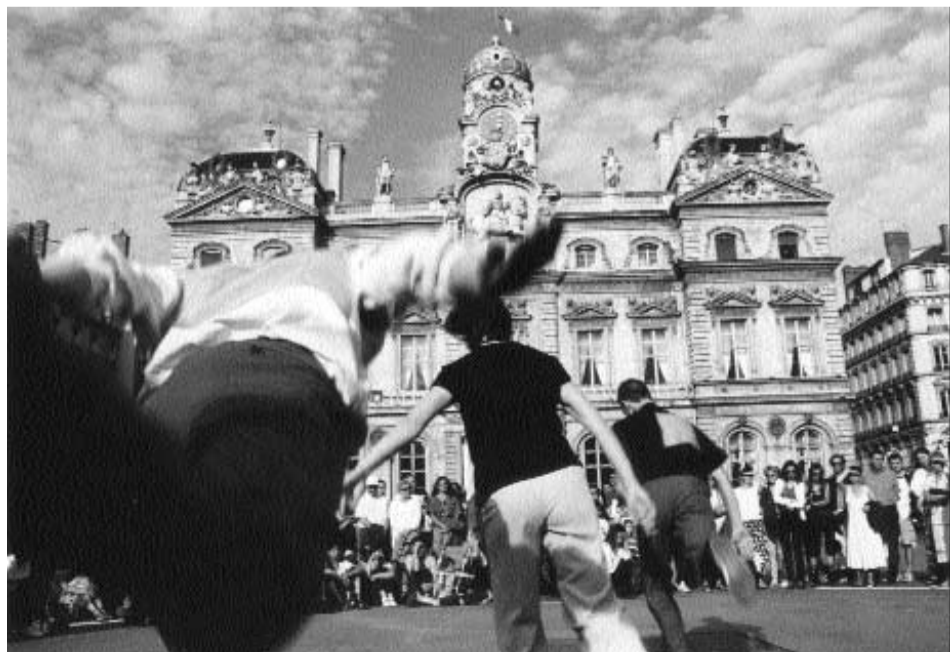
Sous le Ciel exactement Cie Pierre Deloche

Proposer une autre lecture d'une œuvre d'Igor Stravinsky - ici Les Noces - représente toujours un défi et parfois une longue maturation. L'analyse des personnages, leurs relations, le choix de l'écriture, du message s'il y a, peuvent entraîner très loin les relecteurs et s'avérer suffisamment riche que pour devenir le sujet même de la nouvelle version. C'est ce qui est arrivé à la compagnie Linga. Sorte de manuel d'utilisation pour la future lecture des Noces , Quasilesnoces est aussi la traversée des rôles possibles, des hypothèses de scénarios... qui ont surgi des remises en question de Katarzyna Gdaniec , de Marco Cantapulco et de leurs six interprètes. Elle a été créée le 17 mars au Théâtre de Pully.